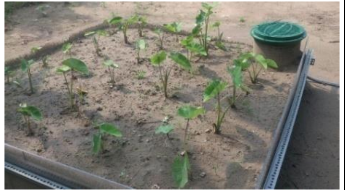
芋頭種植地下灌溉 18 天供水 500kg