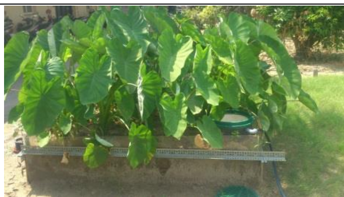
芋頭種植地下灌溉 80 天