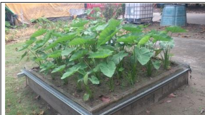
芋頭種植地下灌溉 57 天