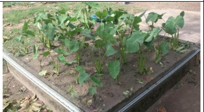
芋頭種植地下灌溉 42 天