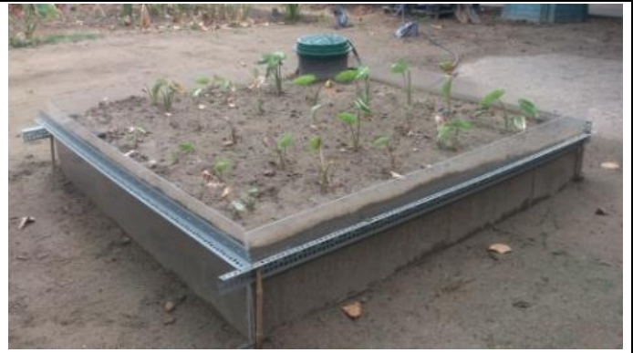
芋頭種植地下灌溉 10 天