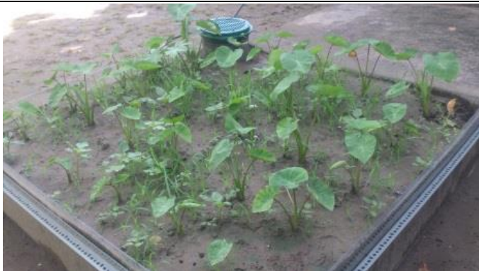
芋頭種植地下灌溉 24 天