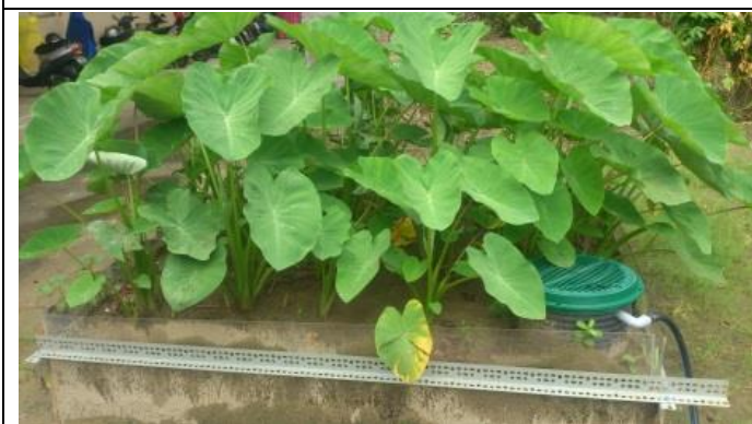
芋頭種植地下灌溉 72 天