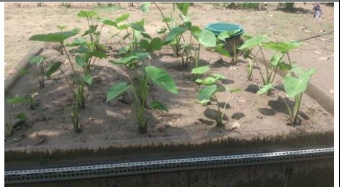
芋頭種植地下灌溉 30 天