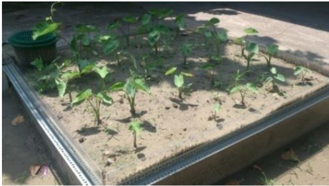
芋頭種植地下灌溉 16 天供水