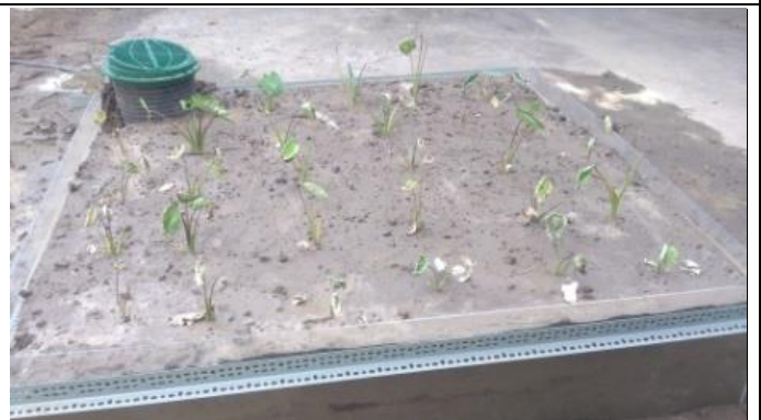
芋頭種植地下灌溉第3天