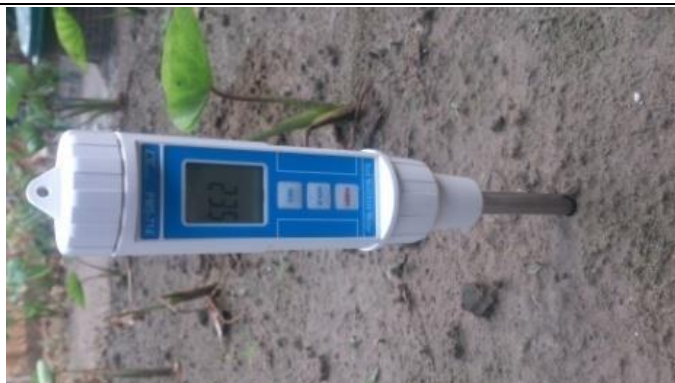
地下灌溉供水 1000kg，濕度 23.5%