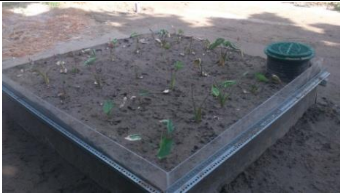
芋頭種植地下灌溉 6 天