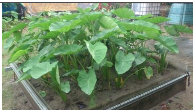
芋頭種植地下灌溉 63 天