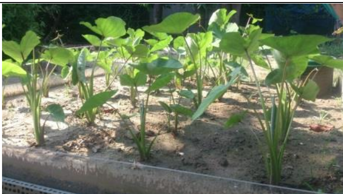
芋頭種植地下灌溉 36 天