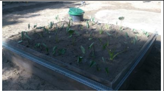
芋頭種植並由地下灌溉供水